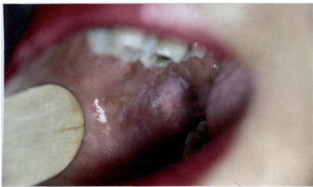
Дискоидная красная волчанка