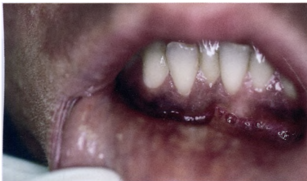
Гиперпигментация на фоне применения плаквенила