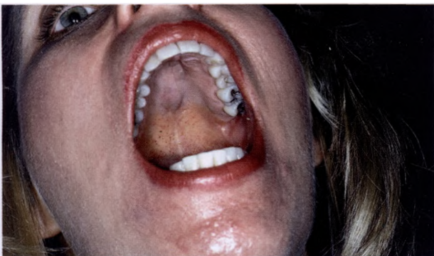
Гиперпигментация на фоне применения миноциклина