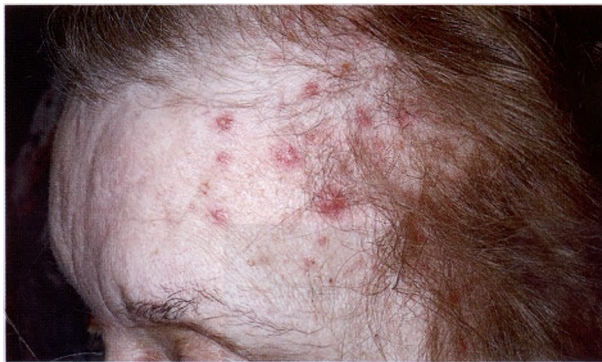
Кожные высыпания при приобретенной недостаточности цинка