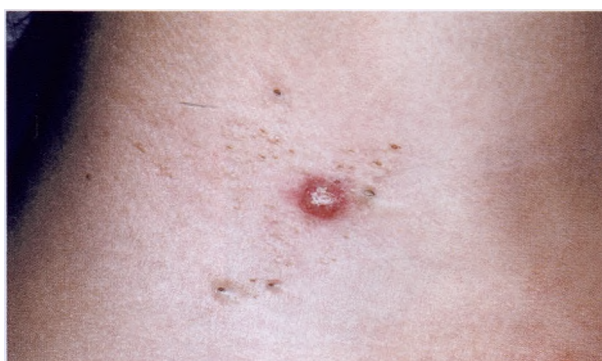
Комедональный невус с воспалительной кистой