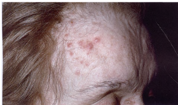
Кожные высыпания при приобретенной недостаточности цинка