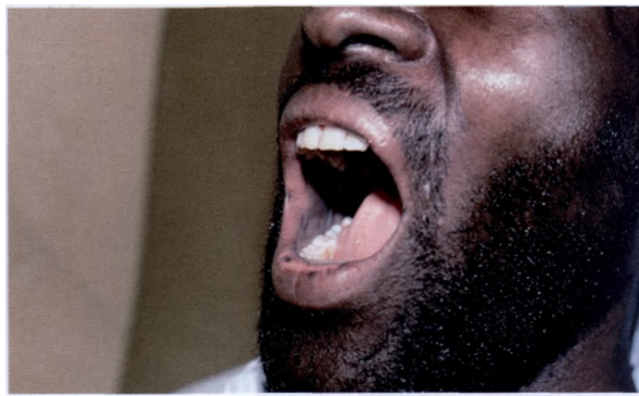
Гиперпигментация на фоне применения зидовудина