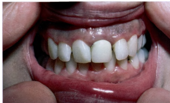
Гиперпигментация на фоне применения плаквенила