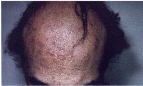
Эозинофильный пустулезный фолликулит